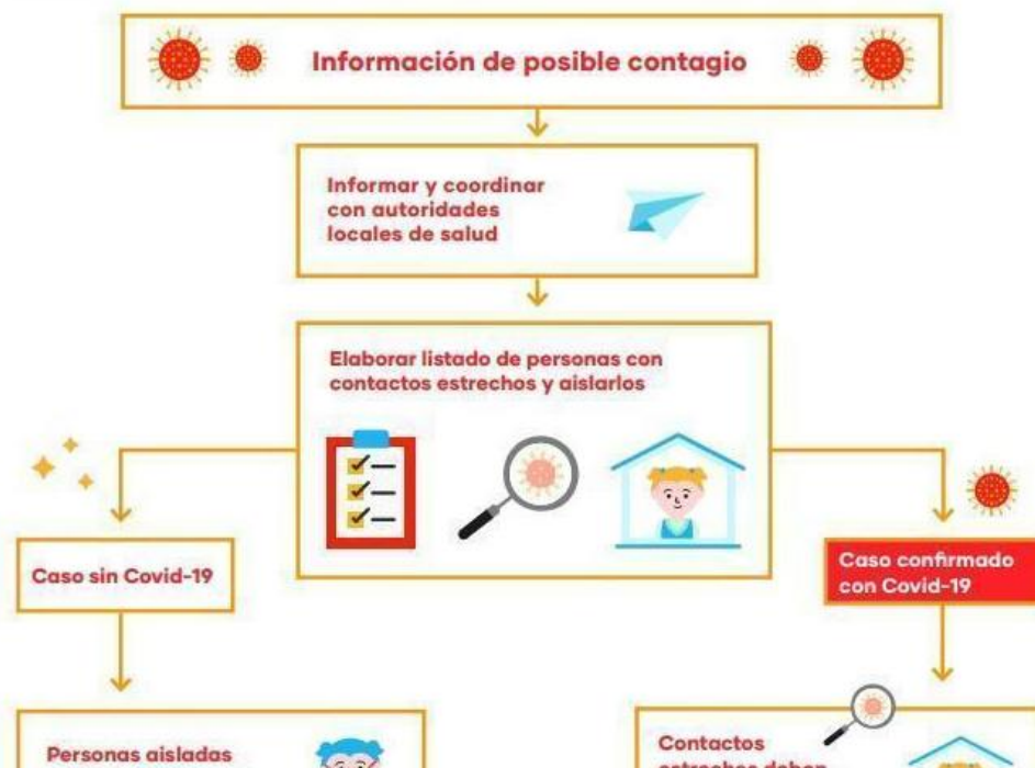
Figura 1: Flujograma de detección y primera respuesta en educación